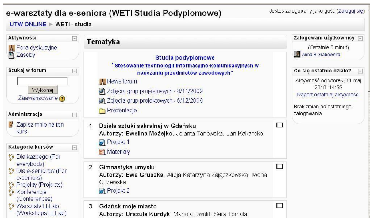
Rysunek 3. Wprowadzenie do e-learningu na platformie Moodle

konkursu są przyznawane na realizację inicjatyw, które angażują osoby starsze do działania na rzecz otoczenia, promują współpracę międzypokoleniową i wolontariat osób starszych. W 2009 roku (II edycja) na konkurs wpłynęło 446 listów intencyjnych. Komisja złożona z niezależnych ekspertów wybrała 37 projektów, które zostały dofinansowane na łączną kwotę 352 800 zł. Wysokość przyznanych dotacji wyniosła od 5 tys. do 12 tys. zł. Realizacja nagrodzonych projektów ruszyła w sierpniu 2009 roku i trwała do kwietnia 2010 roku.