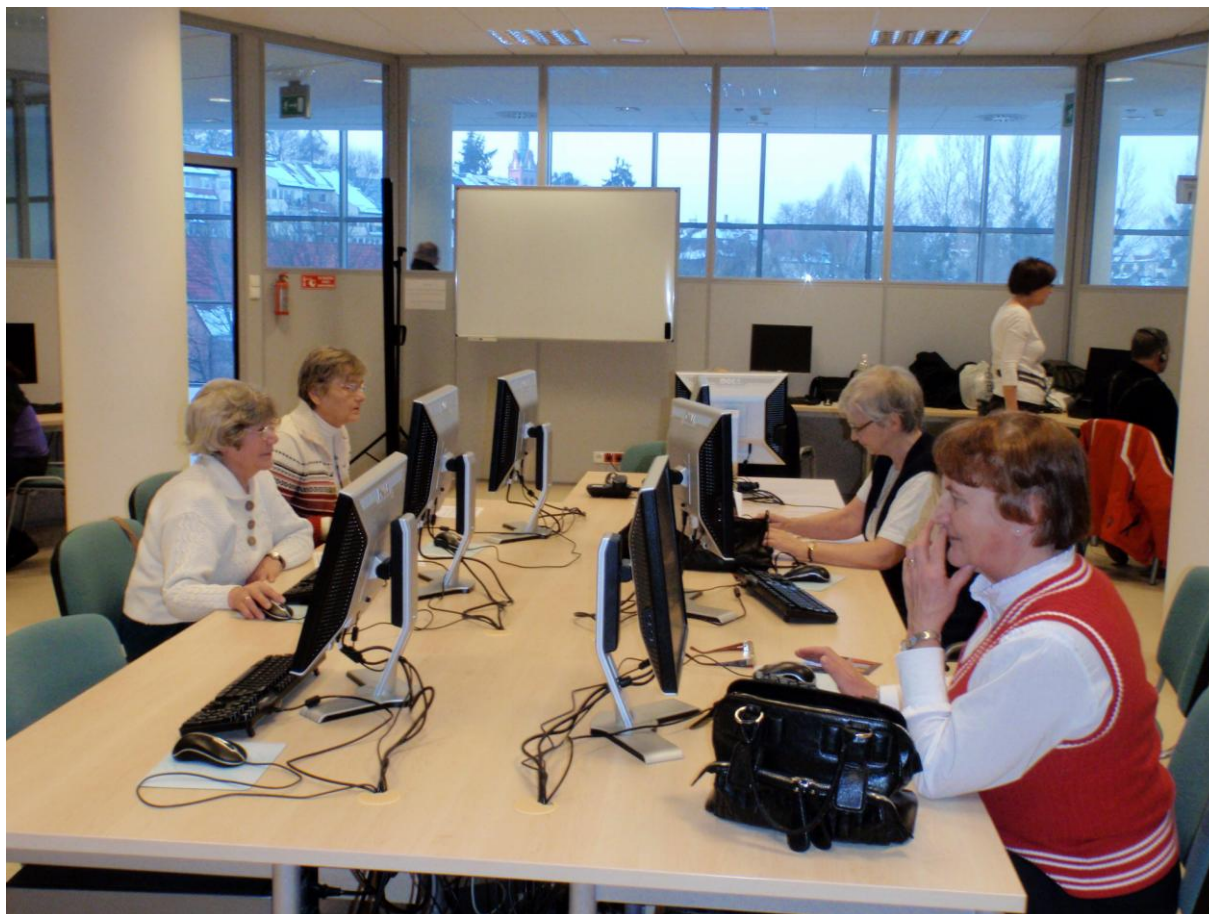
Rysunek 1. Spotkania z komputerem dla seniorów na Politechnice Gdańskiej

(WETI PG) grupa wolontariuszy instruktorów rozpoczęła cykl Spotkań z komputerem w nowoczesnym laboratorium komputerowym WETI PG (Rys. 1).